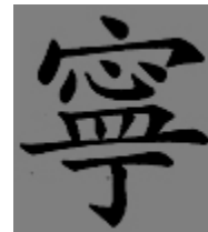
Symbole de Paix Chinois