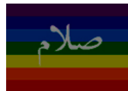
Symbole de Paix Islamique