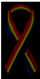
Symbole de Paix du Ruban Arc-en-Ciel